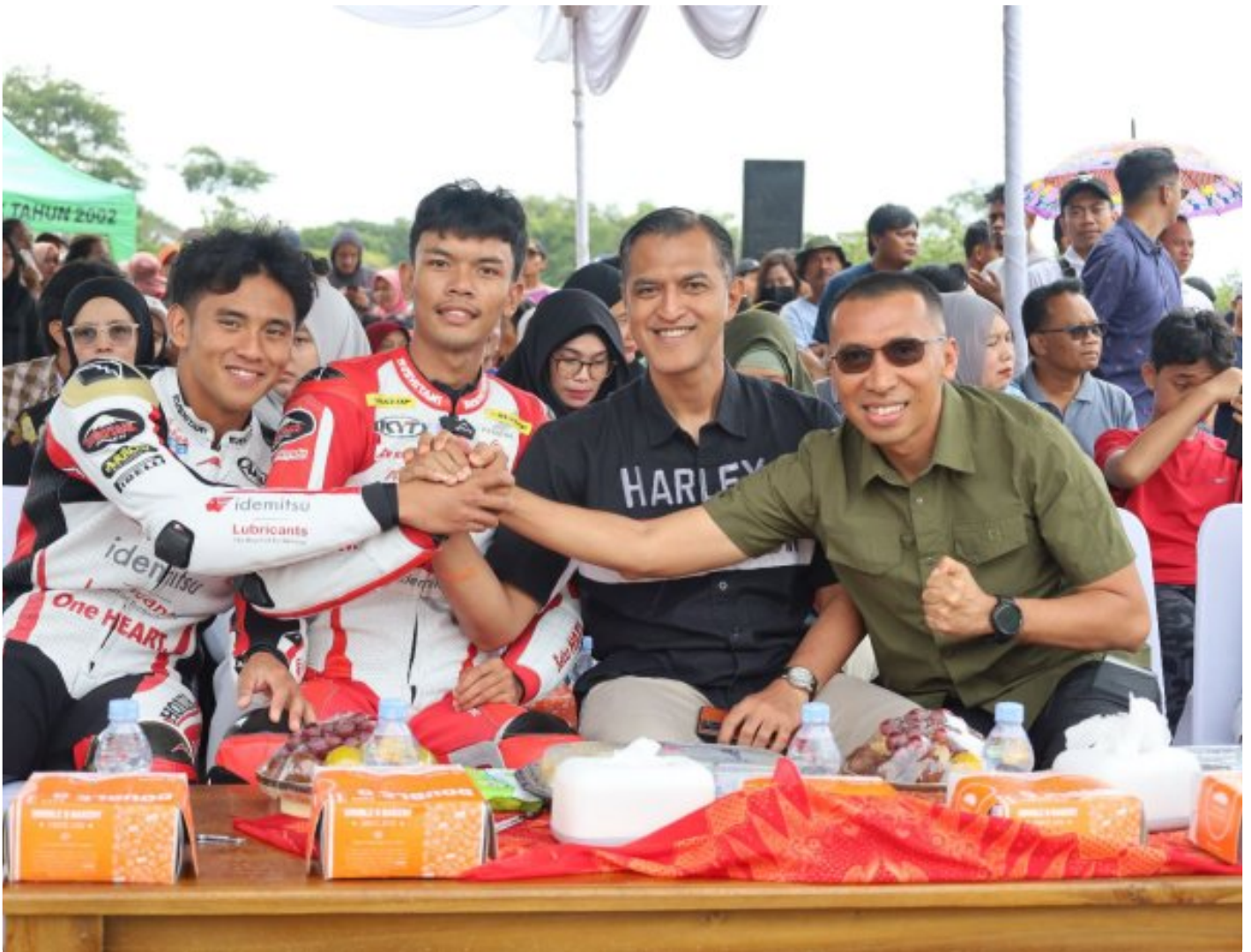
Dandim 0804/Magetan Hadiri Undangan Tinjau Sirkuit Magetan