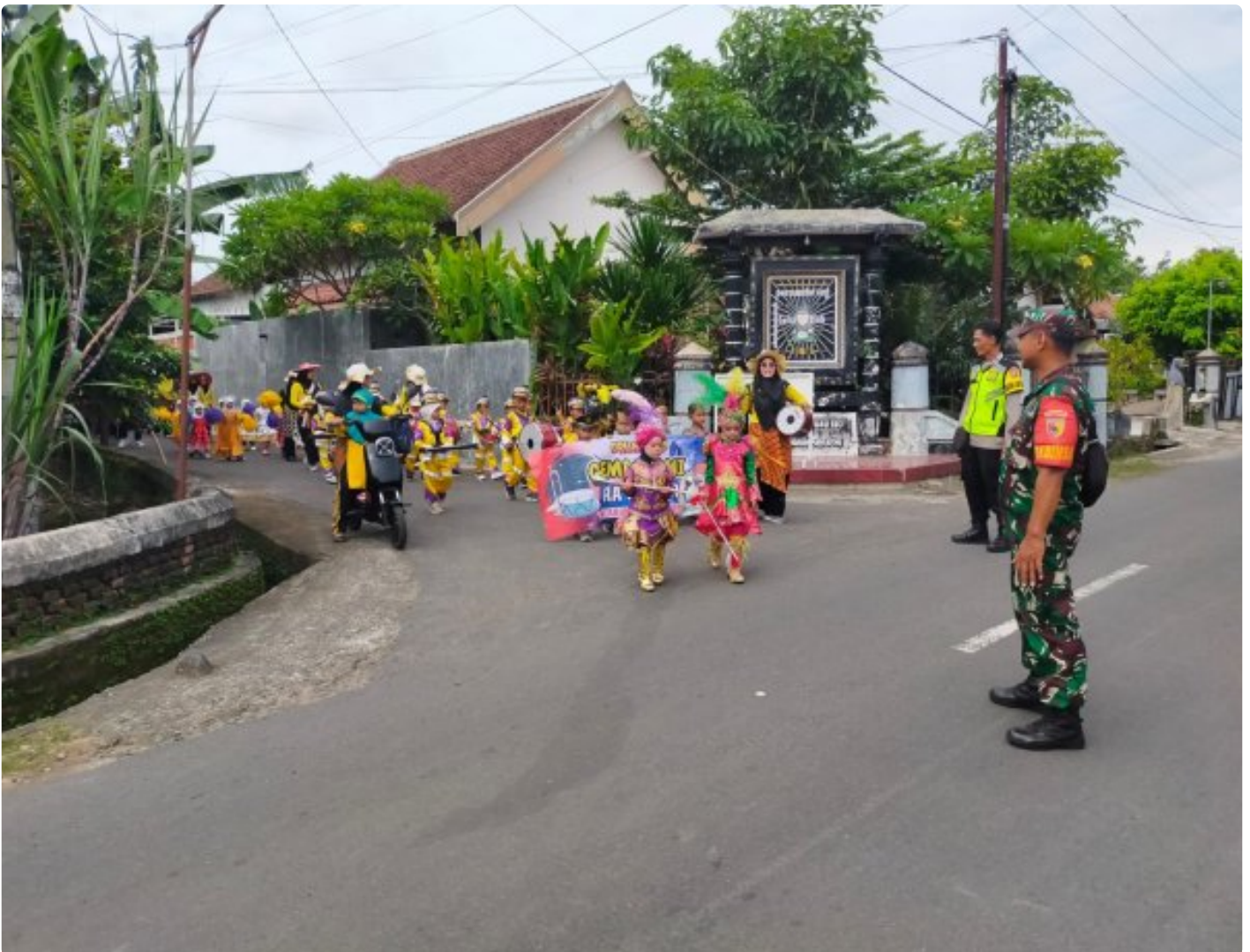
Gebyar Rojabiyah RA dan MI, Babinsa bersama Bhabinkamtibmas Amankan Jalannya Kegiatan Parade Drum Band